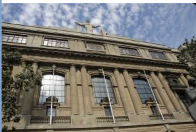
Pontificia Universidad Católica de Chile

Finalmente, me cuesta tener una visión optimista de la enseñanza online o digital. Creo, sin duda alguna, que es una buena herramienta complementaria, pero no puede ser un fin en sí misma. Las consecuencias humanas y psicológicas están por conocerse aún.